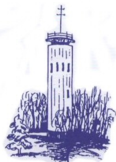
Syndicat Intercommunal des Eaux Erstein Nord

Cette durée peut varier en fonction de la qualité de l'eau rencontrée.