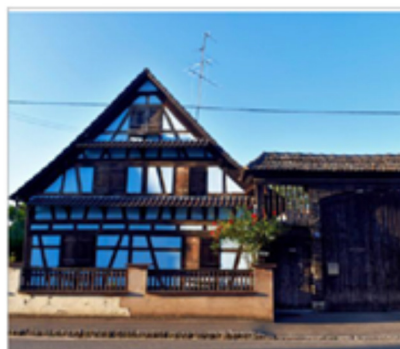
Le village abrite de très belles maisons à colombages.