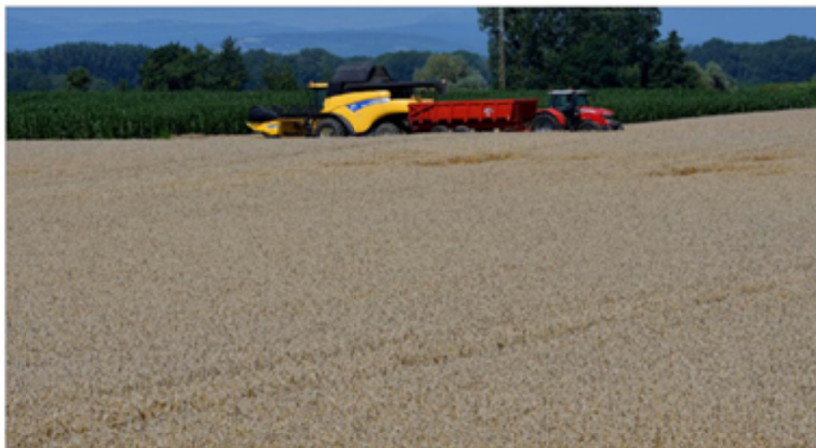
À l'ouest du village, la moisson des blés a débuté.