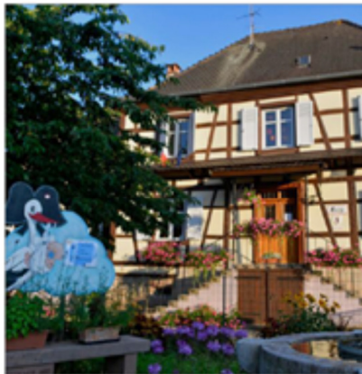
Du côté de la mairie.