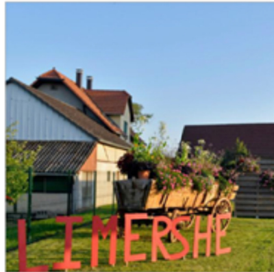
L'entrée de la commune et son décor estival.