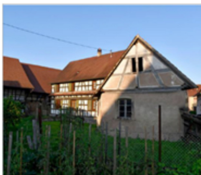
Jeu d'ombre et de lumière.