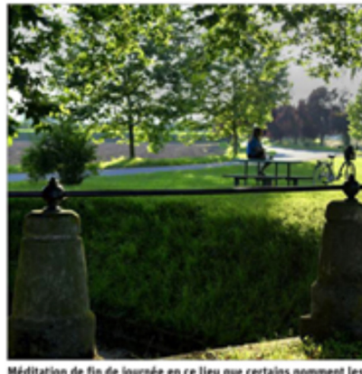
Méditation de fin de journée en ce lieu que certains nomment les « six cloches ».